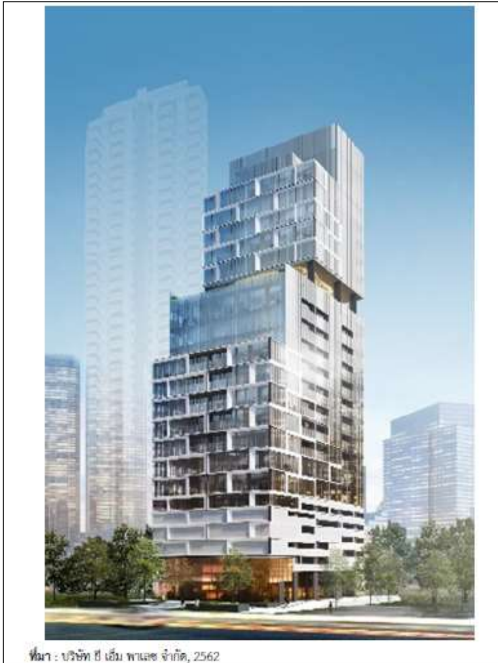
รูปที่ 2.2-1 แบบจำลองลักษณะอาคารของโครงการ

ดังนั้น การก่อสร้างอาคารโครงการ ซึ่งเป็นอาคารคอนกรีตเสริมเหล็ก จำนวน 1 อาคาร และชั้นใต้ดิน 3 ชั้น โดยมีจำนวนห้องพัก 134 ห้อง ห้องเพื่อการพาณิชย์ (ร้านค้า) 1 ห้อง และที่จอดรถยนต์รวม 143 คัน มีความสูงจากระดับพื้นดินที่ก่อสร้างถึงพื้นดาดฟ้าเท่ากับ 83.50 เมตร (มากกว่า 23 เมตร) และมีพื้นที่อาคารที่ใช้คิดอัตราส่วนกับพื้นที่ดิน 21,946.43 ตารางเมตร (มากกว่า 10,000 ตารางเมตร) จึงจัดเป็นอาคารสูง และอาคารขนาดใหญ่พิเศษ ตามพระราชบัญญัติควบคุมอาคาร พ.ศ. 2522